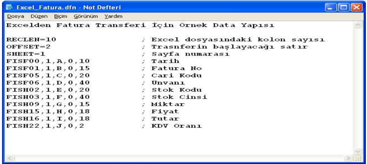
Ekran 2: Excel_Fatura.dfn Dosyasının Yapısı

Örneğimizdeki Excel tablosuna göre uzantısı DFN olan bir dosya hazırlanır. Bu dosya, Excel tablosundaki verilerin ETA tarafından hangi alanlara yerleştirileceği bilgisini içermektedir. Örneğimizde; Excel_Fatura.dfn isimli bir dosya oluşturulmuştur. Bu dosyanın içeriğindeki "FISF00" faturanın tarihini, "FISF01" fatura numarasını simgelemektedir. Bu simgelerin ne olduğu ise EtaSaha.efi dosyasının içerisinde yer almaktadır. (Ekran 3). FISF00 simgesinin yanında yer alan "1" ise saha tipini göstermektedir. (Bu alanların hepsine 1 verilebilir ve sahanın alfanümerik olduğunu gösterir). Hemen yanındaki harf ise aynı alanın Excel'de hangi kolonda yer aldığını gösterir. Onun yanındaki rakam da "10" ilgili sahanın boyunu gösterir.